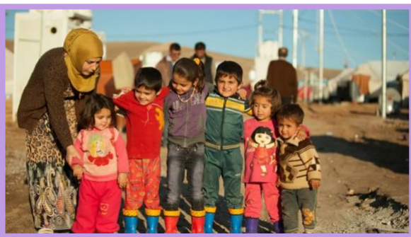
Foto 1. De los candidatos calificados, el ACNUR selecciona a los refugiados más vulnerables como los huérfanos y las mujeres con niños.

Monseñor Silvano Tommasi escribe que no fue una decisión repentina la que empujó a la