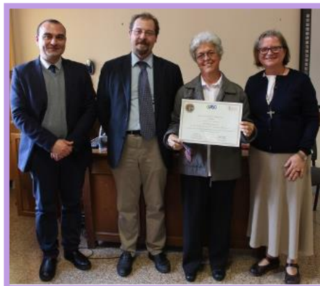
Foto 4. Fin del curso Febrero 2019

En 2018/2019 tuve la oportunidad de participar en el primer curso de capacitación para dirigentes, promovido por otra red internacional "Talitha Kum", vinculada a la UISG y con sede en Roma. El curso, en parte en línea y en parte presencial, se basó en la espiritualidad de la red y se centró en varias mujeres del Evangelio: María e Isabel, la mujer encorvada y otras, como referencia de cómo debemos acoger y trabajar con las víctimas de la trata de personas. La doctrina social de la Iglesia, la sociología, aspectos de la psicología y la antropología, entre otros, fueron temas desarrollados durante el curso. Las dos sesiones presenciales fueron extremadamente ricas en contenido, con varias redes que compartían lo que estaban haciendo a nivel mundial.