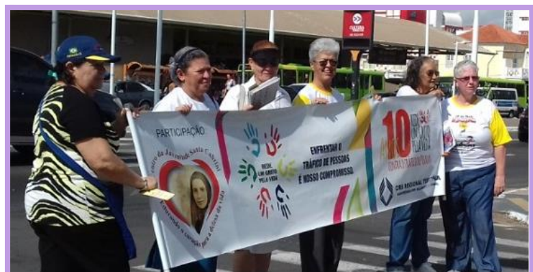
Foto 2. Celebración de los 10 años de la red en una manifestación contra la trata de personas